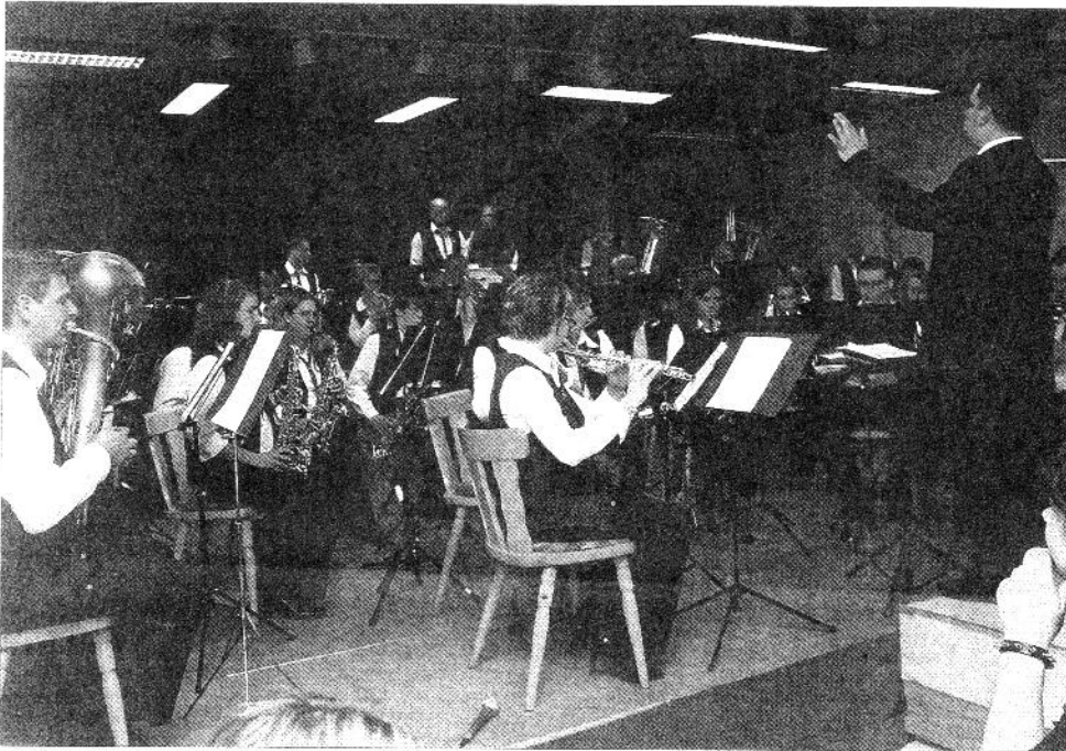
Ein gelungenes Konzert präsentierte der Musikverein „Gloria“ Niederhosenbach im Dorfgemeinschaftshaus. Die Programmgestaltung war ganz nach dem Geschmack der Zuhörer.