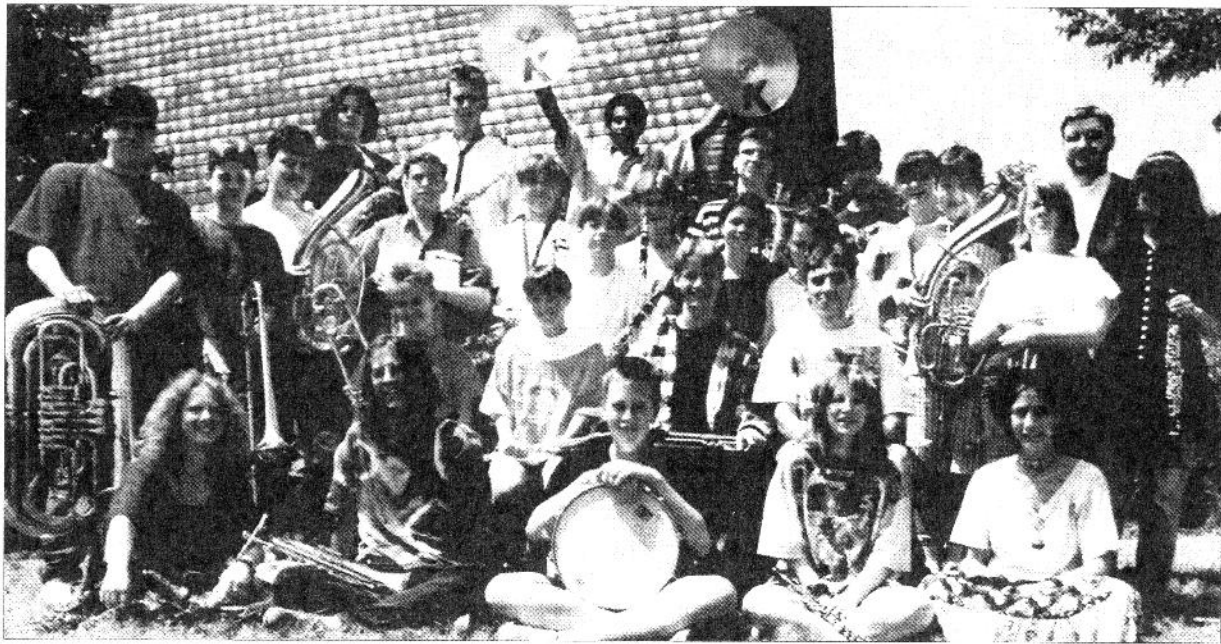
Trommel, Posaune und Becken gehören zwingend dazu: Das Jugendorchester der Feuerwehr in Rhaunen besteht seit 20 Jahren – ein Grund zum Feiern.